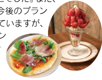
自家製野菜を使用したピザや一番人気の「季節のデザート」

移転を決意した段階から商工会議所に相談に乗っていただき、他の融資制度も説明をいただきましたがマル経融資に決めました。条件面のみならず、申請手続きや投資計画、売上計画、プロモーションなどの事業計画作成において商工会議所の支援を受けながら進められたことがありがたいことでした。また、融資実行後も定期的にお越しいただき、進捗の確認や今後のプランについても相談しています。おかげ様で順調に推移していますが、今後の課題である駐車場の整備や以前同様のドッグラン設置について、マル経の借換も視野に入れ、資金繰り計画を立てながら来年度以降着手する予定です。