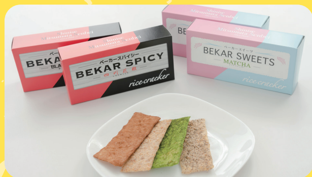
〈老舗三俣せんべい〉 ベーカースイーツ594円 ベーカースパイシー594円