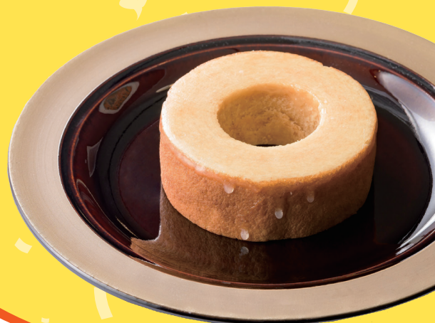
〈The Butter Baum〉 リッチソフトホール 1,850円