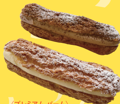
〈プレミアム バーム〉 ザクレア378円