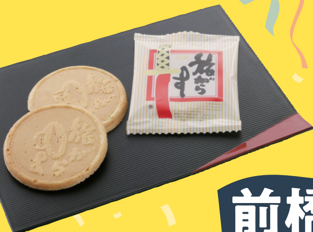
〈旅がらす本舗清月堂〉 旅がらす(8個入)669円