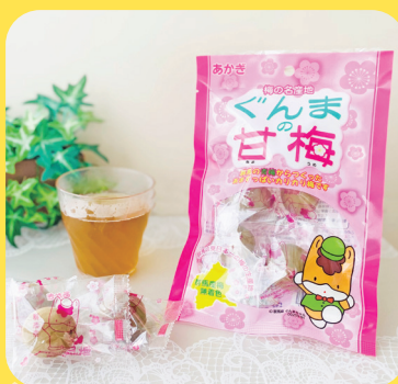
〈赤城フーズ〉 ぐんまの甘梅 300円