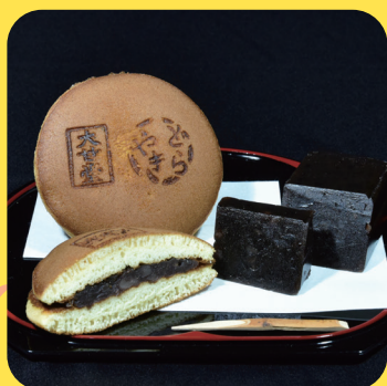
〈大甘堂菓子舗〉 花豆まるまる羊羹700円 大どら焼き270円

※数量に限りがございますので、品切れの際はご容赦ください。 ※価格はすべて税込表記です。※画像はすべてイメージです。 ※記載の商品以外にも多数揃えております。